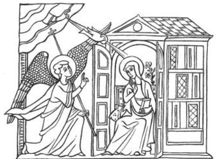
«Il Signore è con te» Luca 1,28

Allora Maria disse all'angelo: «Come avverrà questo, poiché non conosco uomo?». Le rispose l'angelo: «Lo Spirito Santo scenderà su di te e la potenza dell'Altissimo ti coprirà con la sua ombra.