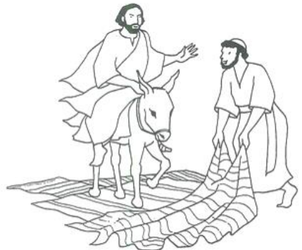
«Benedetto colui che viene nel nome del Signore» Marco 11,19

Benedetto colui che viene nel nome del Signore! Benedetto il Regno che viene, del nostro padre Davide! Osanna nel più alto dei cieli!».